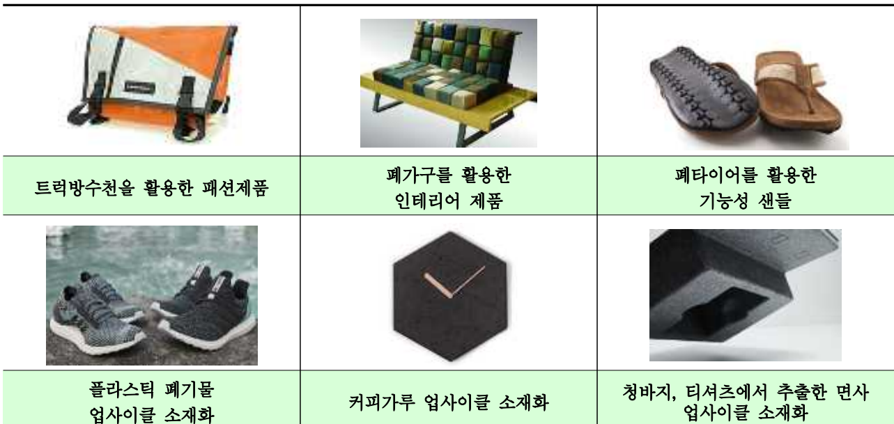
< 업사이클 제품 및 소재 예시 >